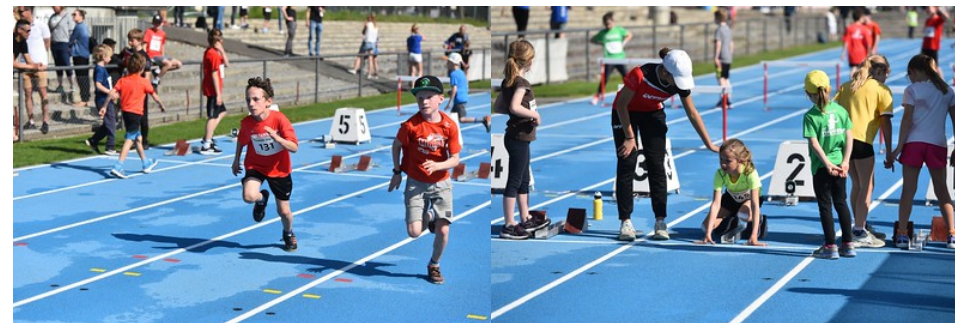
Bilder: Daniel Werthmüller