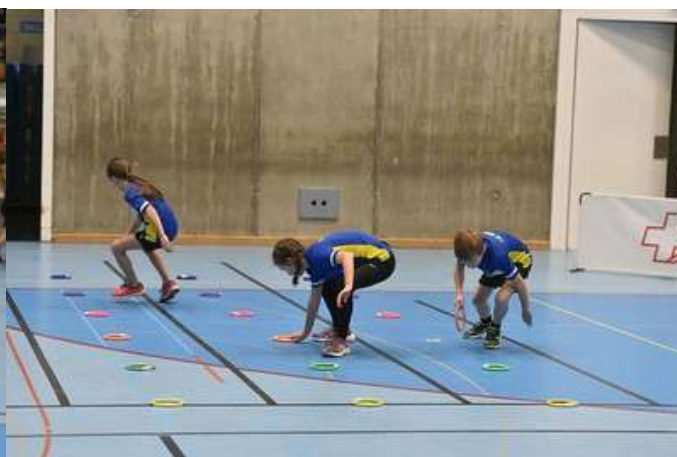
Bilder: Daniel Werthmüller