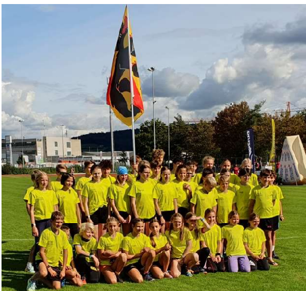
CH-Final Mille Gruyère in Genf