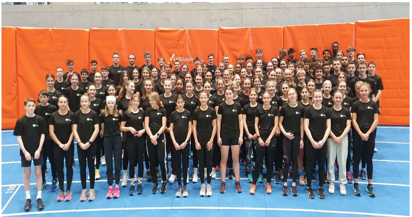
Das BLV Regionalkader 2023

14x N-Card (Swiss Starter Future), 50x R-Card, 28x L-Card