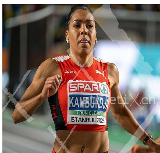
Hallen-Europameisterin: Mujinga Kambundji